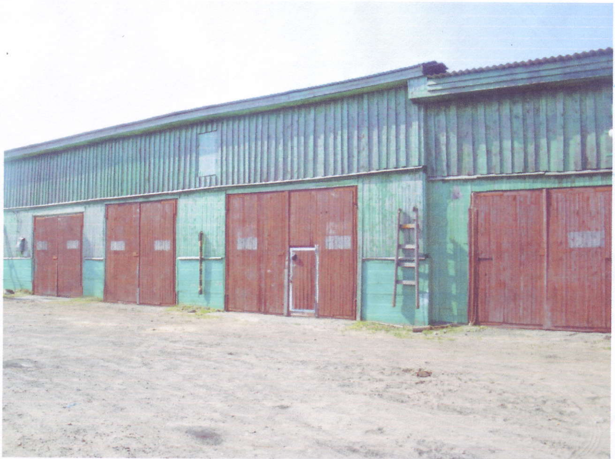
Гаражи учебного комбината.