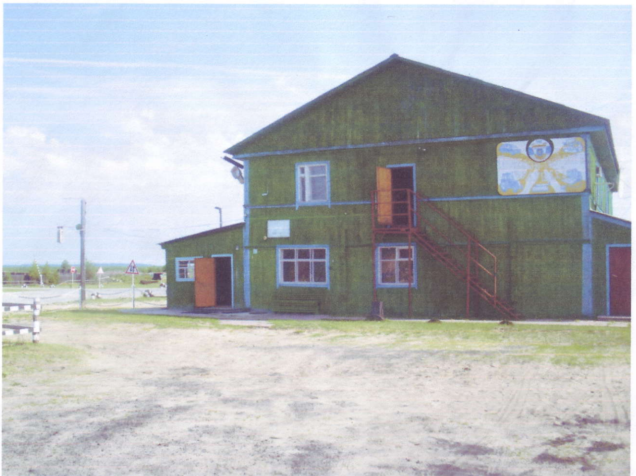
Вход в учебный корпус №1.