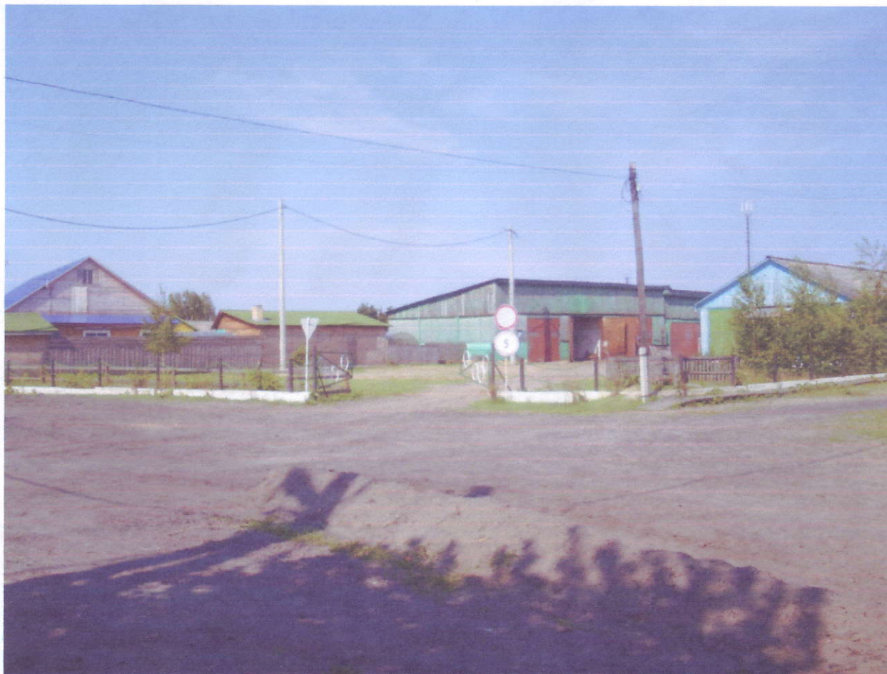
Въезд на территорию учебного комбината.