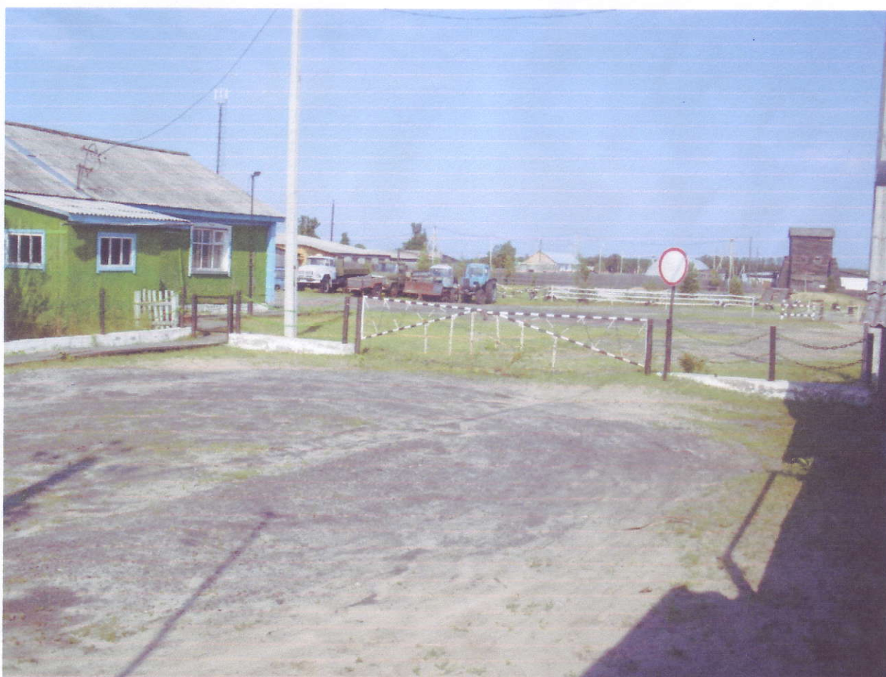
Запасной въезд на территорию учебного комбината.