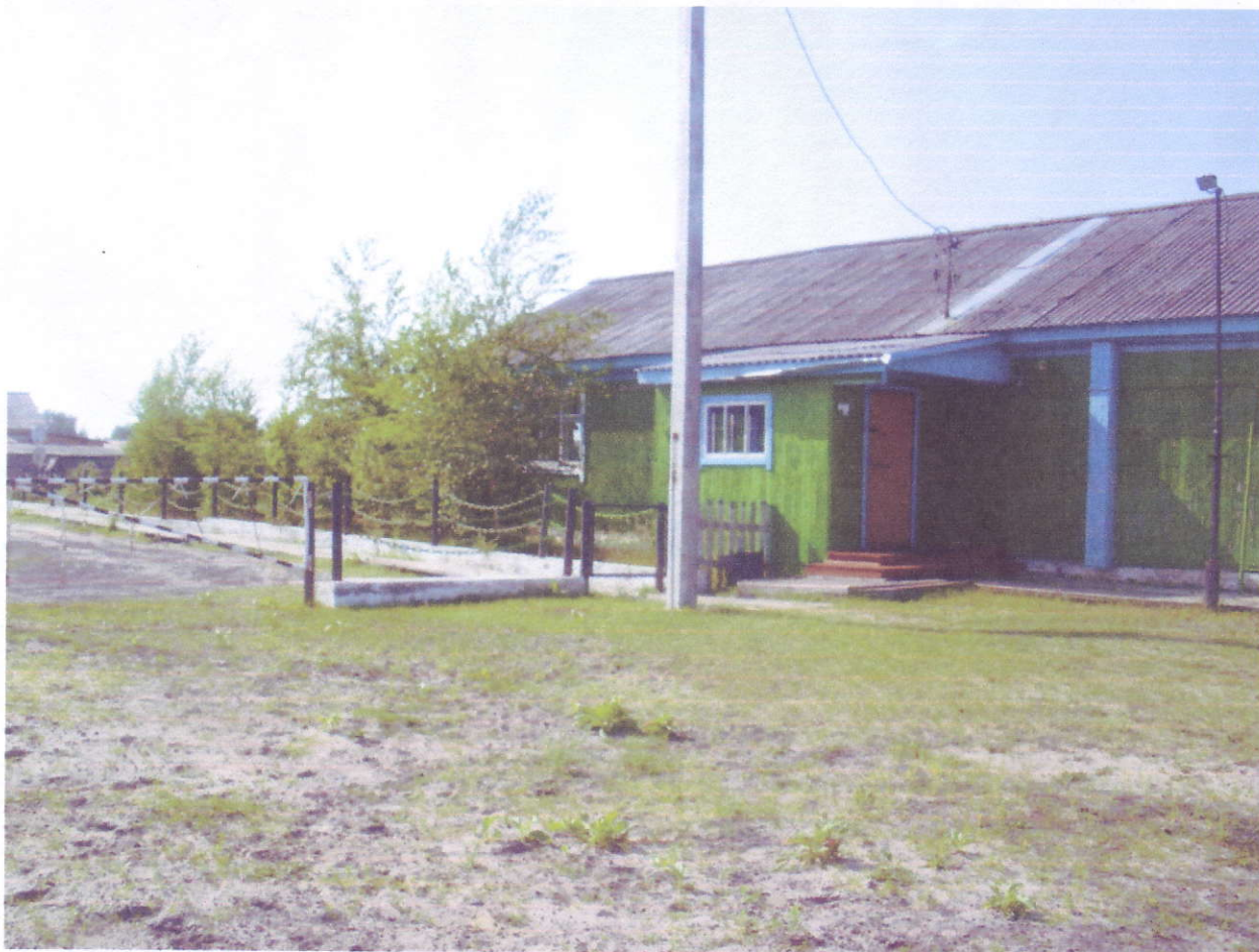
Вход в учебный корпус № 2.