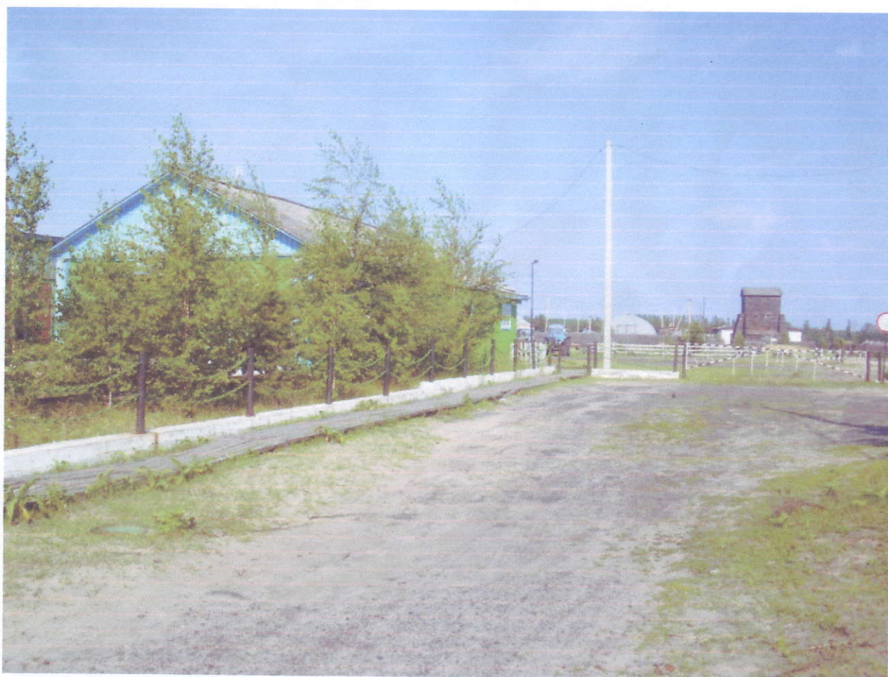
Вход на территорию учебного комбината.