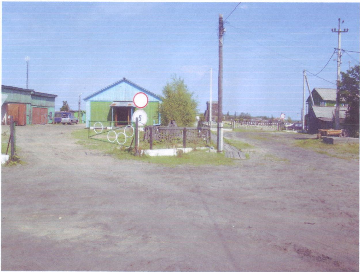
Въезд и вход на территорию учебного комбината.